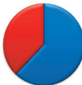
Zastupljenost žena u Parlamentu Crne Gore